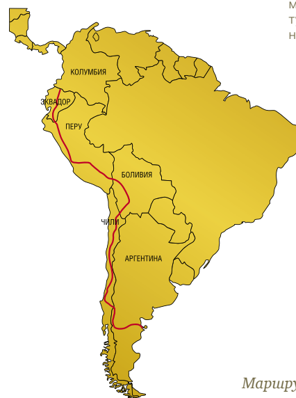
Маршрут по Южной Америке

По горному серпантину выдавший виды автобус вывез нас к переправе через реку. На другой стороне реки виднелись какие-то хижины. Паренек, переправлявший нас на пироге к своей деревне Дурено, очень сильно удивился двум гринго, которым зачем-то понадобилась эта община и в которой они собирались провести пару дней. Оказывается, уже много лет сюда никто из туристов самостоятельно не добирался.